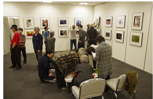
前日の搬入作業風景

58点、顧問・審査会員18名中17名の出品は圧巻でした。「充実した作品揃いで毎年楽しみ」「他の写真展とはさすがに違います」と満足の来場者は例年並みの1,464人。同時開催の学生道展の60点は、今年も若い感性が溢れる作品が揃いました。役員ばかりでなく、会員有志で取り組んだ額入れ作業、ご苦労様でした。作品出品、前日の展示作業、会場当番、撤去作業と全員総がかりの努力と熱意が結集された札幌支部会員写真展となりました。写真道展出品作との重複は、支部活動として認められています。今年未出品だった方は来年は是非、札幌支部在籍の証としても参加を。