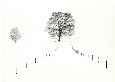
2位 大久保 真