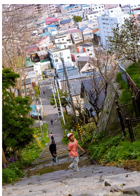
1位 木全 正樹