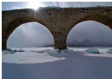
1位 褰田祥健 「眼鏡橋」