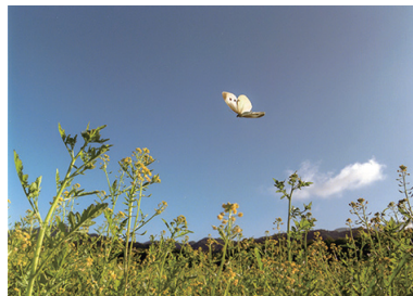
2位 山形典夫 「朝日の中を」