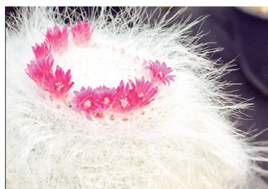
2位 府中紀一 「サボテンに花の冠」