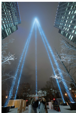
1位 安田敏彦 「願いのかたち」