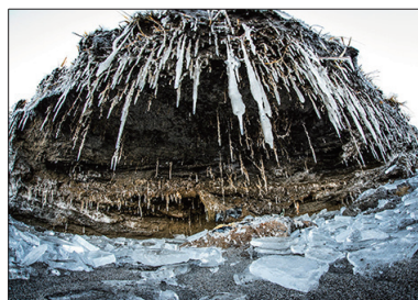
2位 襲田祥健 「氷柱の口」