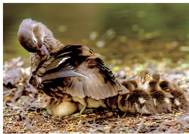
1位 山形典夫 「母のぬくもり」