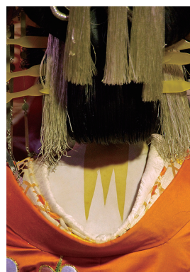
2位 山本隆晟 「うなじ」