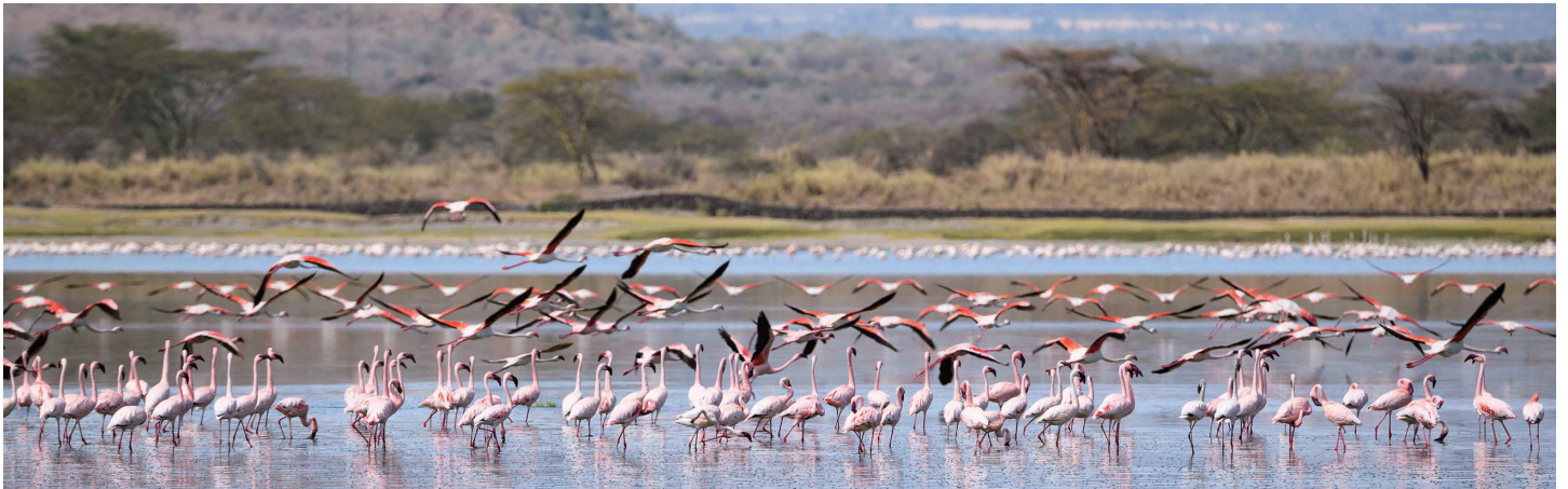
目を奪う圧倒的な紅鶴群