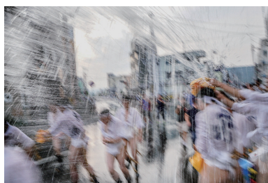
1位 城 伊志勝 「祭りの洗礼」