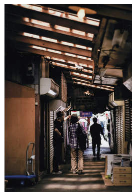
2位 木全正樹 「中小路に迷う」