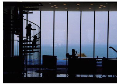
2位 大竹 勝 「プレイルーム」