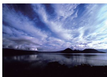
2位 高谷喜一 「夜明けの湖」